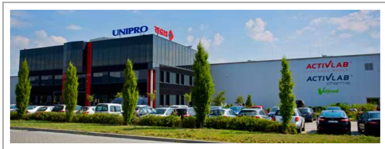
Farmacja, suplementy – zakład produkcyjny UNIPRO