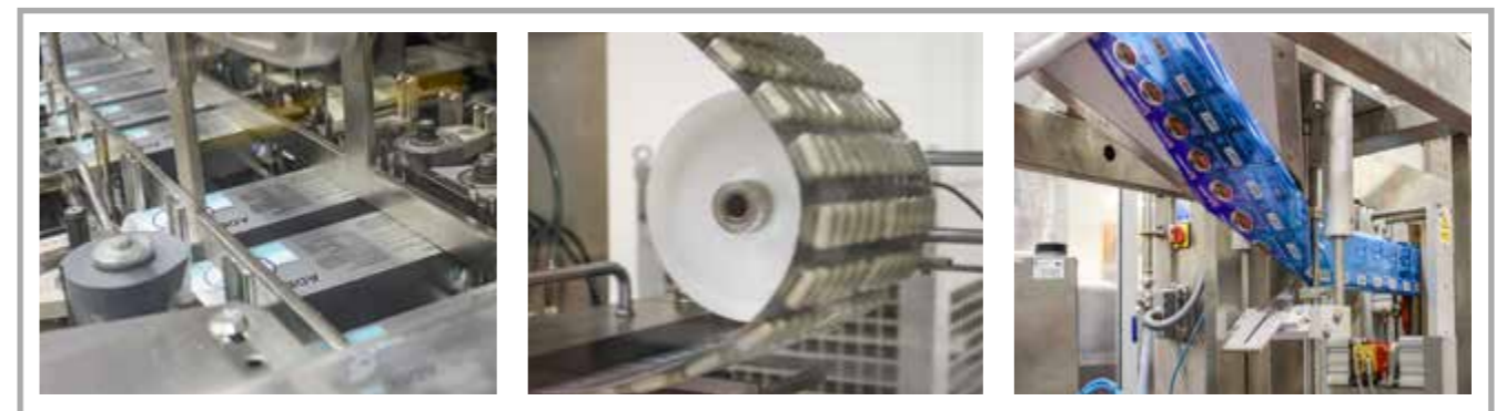
Produkcja suplementów UNIPRO

Marka Activlab Pharma jest produkowana przez UNIPRO, polską firmę za którą stoją trzy dekady doświadczenia w produkcji i handlu detalicznym.